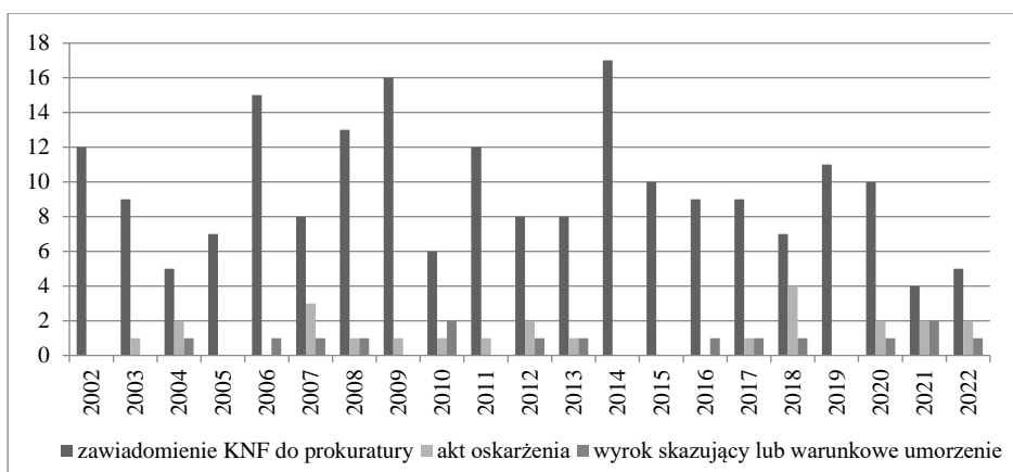
Wykres 2. Ujawnianie i wykorzystywanie informacji poufnych w latach 2002–2022